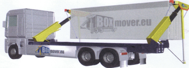
Zum Absetzen von Containern: Seitenlader von Hubauer

Die Erfindung von Hubauer (AT 501158 B1) vereinfacht die Schwenkbewegung des Containers, indem die Ketten an einem Waagebalken angeschlagen werden, was die Gefahr des Umkippen der Box bei hohen Schwerpunkten vermindert. Der Stützausleger wird zunächst zur Seite ausgefahren und mittels Seil gesichert. Der Schwenkarm ist konstruktiv so ausgelegt (angewinkelt), dass beim Ausfahren des Hubzylinders zugleich der Stützausleger belastet wird. Durch das hydraulische Verkürzen des Auslegers und das Verlängern des Schwenkarmes wandert der Container in seine Absetzposition. Gegenüber den bekannten Konzepten ist das System wegen des Fehlens eines besonderen Auslegers am oberen Ende des Tragarms sehr leicht.