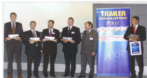
Fester Termin im IAA-Kalender: die Verleihung des Branchenpreises „Trailer-Innovation“